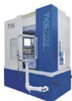
秦川 YKS7225 数控蜗杆 砂轮磨齿机