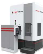
长机 YKS5132H _803磨齿机