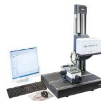
德国马尔 UD130综合齿轮和表面测量站