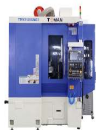
陀曼 tmy3125cnc 滚齿机