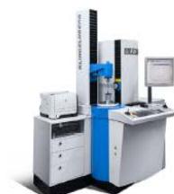
克林贝格 p26 精密测量中心