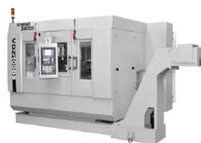
舍勒 双主轴立式车削中心QVDZ 100DS