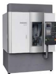
浜井 HAMAI N80滚齿机